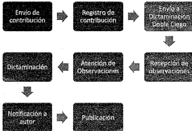
Diagrama de proceso de dictamen:

Todas las colaboraciones que se reciban para su publicación estarán sometidas a un proceso de evaluación por el consejo editorial externo. Dicha dictaminación se realizará con el método de "doble ciego", en donde los miembros del mismo determinarán la viabilidad de la publicación de la obra, pudiendo, según el caso, aceptar el artículo, solicitar modificaciones o rechazar las propuestas. Una vez emitidas observaciones del consejo editorial externo, el autor deberá realizar las correcciones correspondientes, quedando comprometido a reenviar su trabajo en un plazo no mayor a 20 días hábiles contados a partir del día en que sea notificado. Los trabajos que no cumplan con los requisitos establecidos en los lineamientos editoriales serán rechazados.